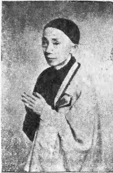
Tu sĩ VIÊN - TÀI